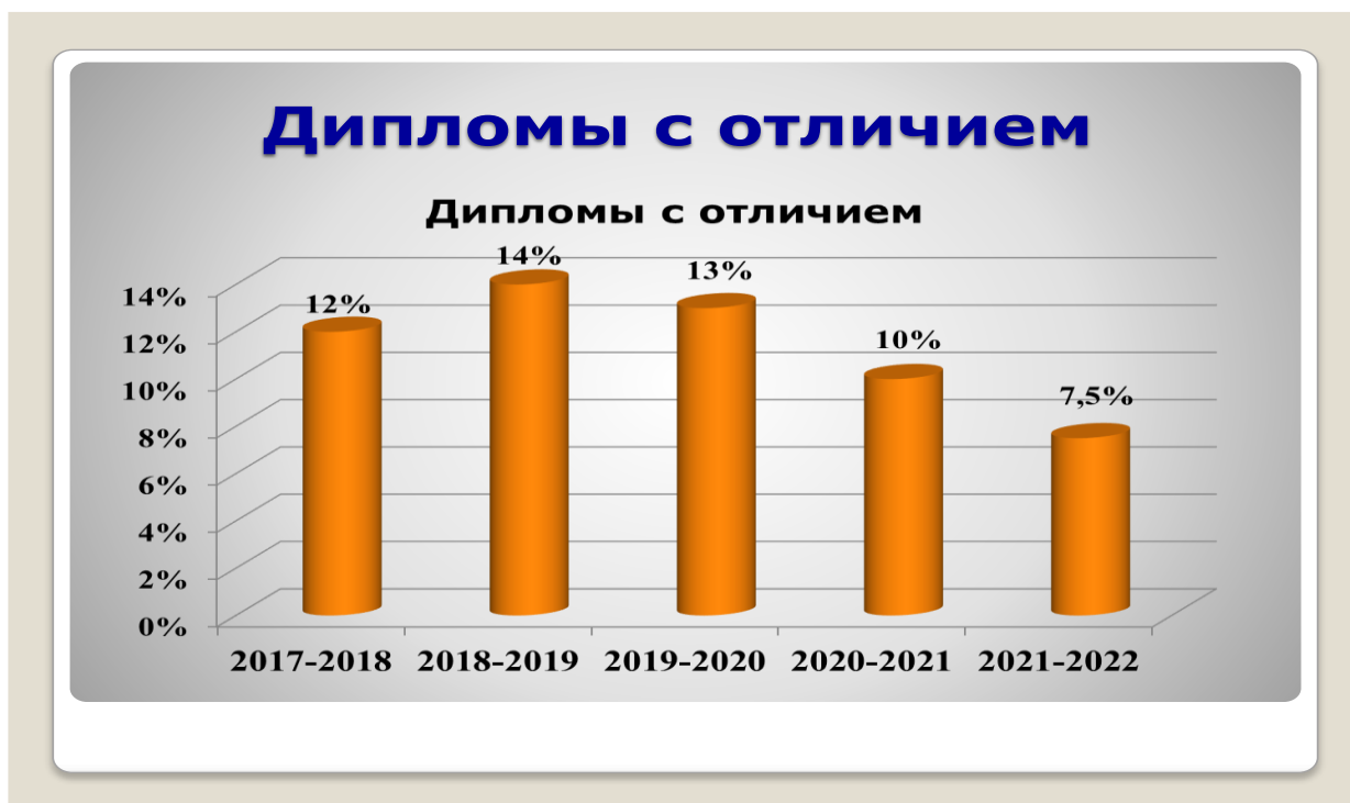
Рисунок – Динамика показателя «Дипломы с отличием»

В 2022 году дипломы с отличием получили 22 студента, что несколько ниже уровня прежнего года. Динамика показателя по количеству дипломов с отличием представлена диаграммой.