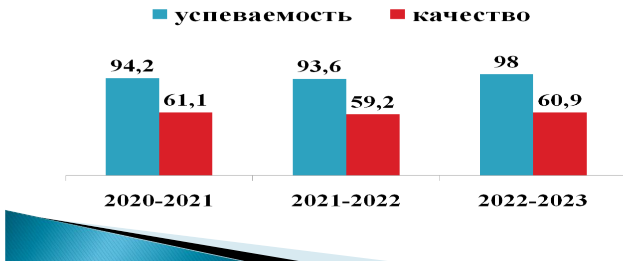
Рисунок- Динамика успеваемости и качества подготовки обучающихся СППЭК

Анализ успеваемости показал, что в отчетном периоде общая успеваемость возрасла (на 4 %), качество подготовки студентов возросло на 1 %.