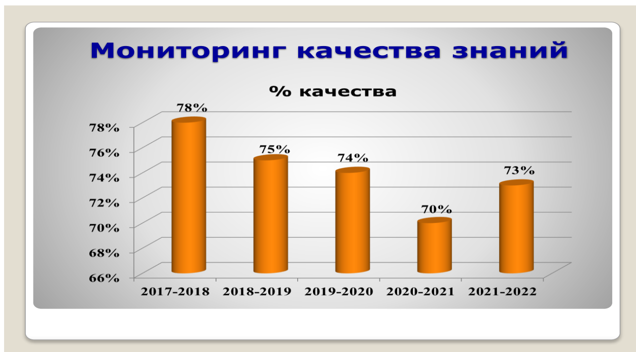
Рисунок – Мониторинг качества знаний

Мониторинг качества знаний демонстрирует качественную успеваемость в 73% — это достаточно высокий показатель. Однако за последние пять лет наблюдается некоторое снижение данного показателя (рисунок).